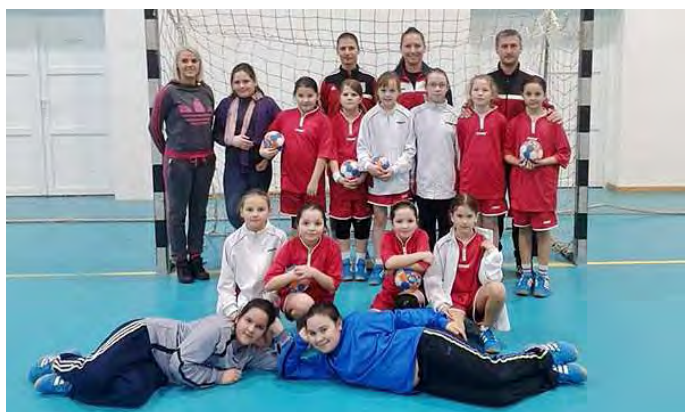
Kézilabda U 10