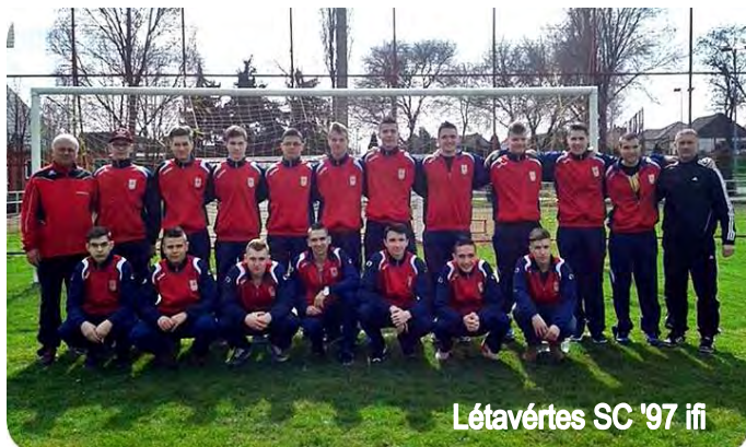
Létavértesi SC '97 ifi