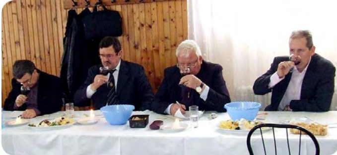
Munkában a zsűri

A Városi Könyvtár és Művelődési Ház és a Szőlősgazdák Egyesületének szervezésében március 5-én került sor a 14. Létavértesi borverseny megrendezésére. 32 hazai (Létavértesen termelt) és 33 vendég (Székelyhídról, Bihardiószegről, Hegyközszentmiklósról) bort neveztek a gazdák.