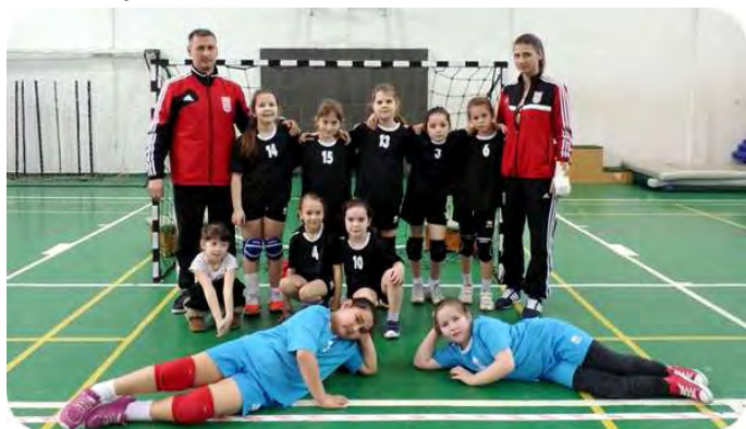
Kézilabda U 8

Utánpótláskorú kézilabda csapataink közül az U-10. korosztály hazai környezetben a Berettyóújfalunál, majd idegenben a Hajdúnánás otthonában játszott színvonalas mérkőzést.