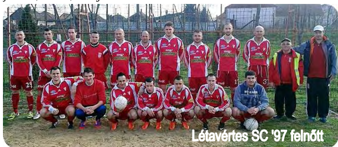
Létavértesi SC '97 felnőtt

A felnőtteknél nagyobb változás nem történt. Van egy-két távozó játékos, és van, aki újra kezdte a munkát.