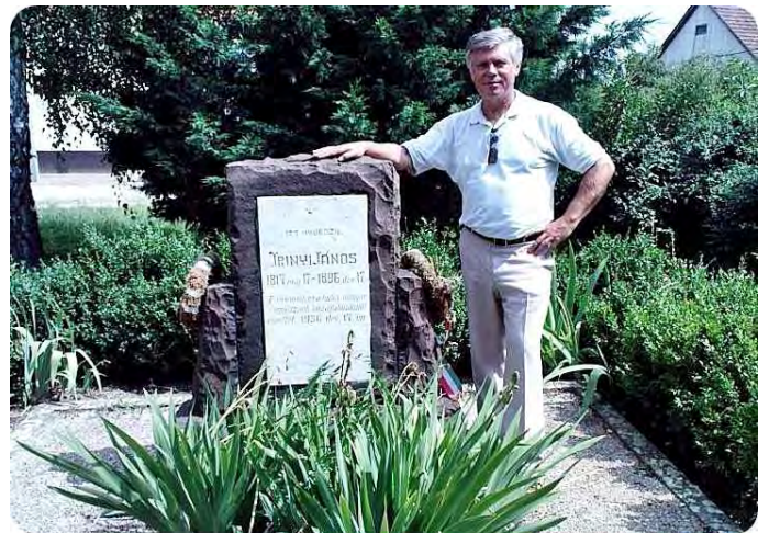
Irinyi János sírjánál

Sorsa nagyon hasonlít Bolyai Jánoséra abban, hogy leghíresebb munkáját ő is saját pénzén jelentette meg, élete jelentős részét szintén magányosan, tudományos kapcsolatok nélkül élte le, de ennek ellenére ő is jelentős életművet hagyott hátra, mégis szegénységben, ismeretlenségben halt meg. Magyarországi, romániai - főleg a nagyváradi- levéltárban lappangó tudományos hagyatéka még olyan szinten sincs feldolgozva, mint Bolyai Jánosé. Ez a feladat még egy kémiaihoz és tudománytörténethez egyaránt értő tudós szakemberre vár. Csak remélhetjük, hogy előbb-utóbb magyar honban akad majd ilyen szaktudós, aki ehhez a feltáró munkához megfelelő támogatást is kap.